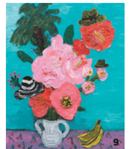
1. “Valley Road Flowers”, 2019. 2. “It Me”, 2019. 3. “Girls Girls Girls”, 2019. 4. “The Green Parrot”, 2018. 5. “Marlboro”, 2018. 6. “Donatella”, 2018. 7. “Parliament of Birds”, 2019. 8. “Muse”, 2018. 9. “Miami Flowers”, 2019.