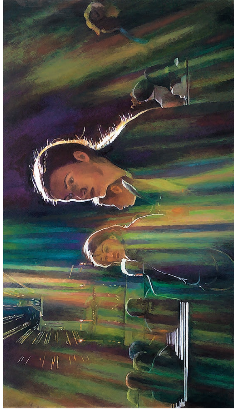
Silvia Gertsch · St. Stephen's Cathedral, Vienna II, 2012, Hinterglasmalerei, Öl auf Glas, 86 x 150 cm