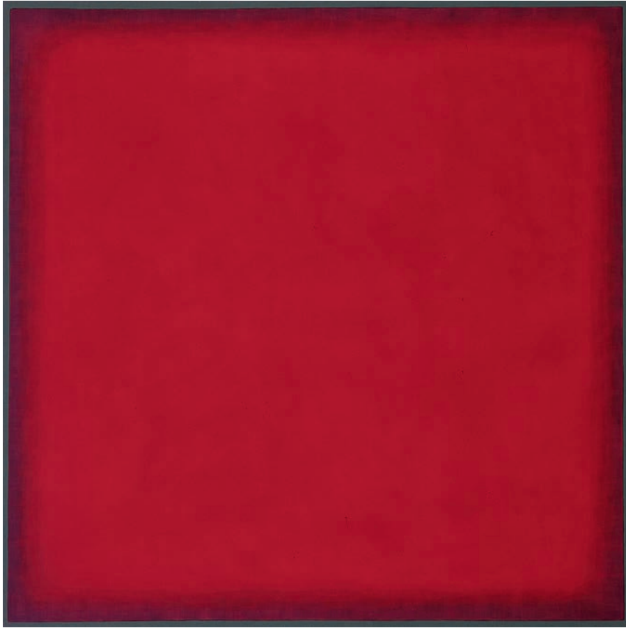
Xerxes Ach · Painting, 2003, Malerei, 140x140 cm, Eitempera, Pigment auf Baumwolle.