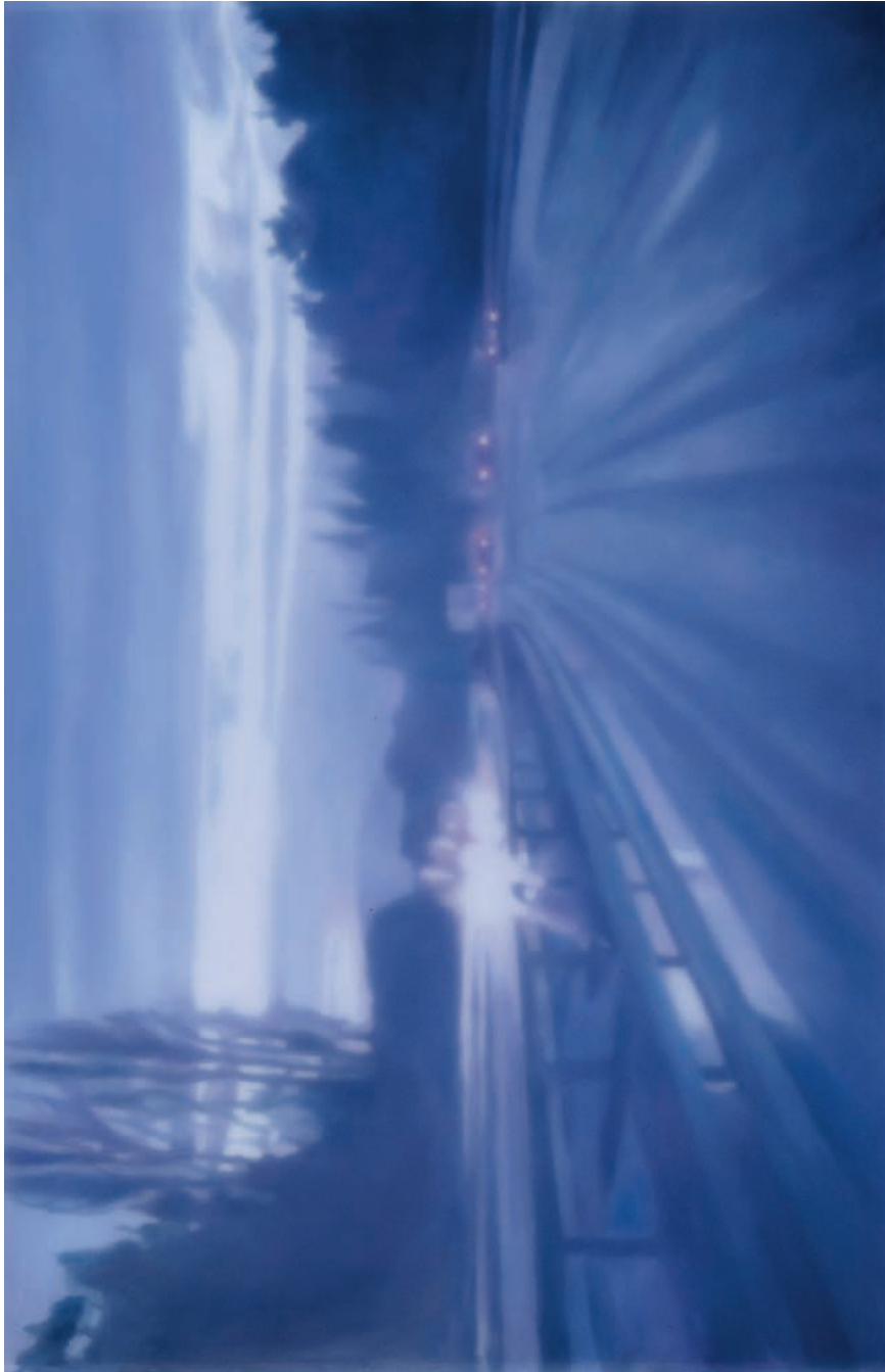
Silvia Gertsch · Movie, 2000, Öl hinter Glas, Lack auf Glas, 77 x 119 cm, Kunstmuseum Bern, erworben mit Mitteln der Bernischen Kunstgesellschaft, Courtesy Galerie Monica de Cardenas

Silvia Gertsch (*1963, Bern) lebt und arbeitet in Rüscheegg Seit 1984 als freie Künstlerin tätig Seit 1988 ausschliesslich Arbeit mit Hinterglasmalerei 1992 Begegnung mit Xerxes Ach, seither intensive Lebens- und Arbeitsgemeinschaft 1993 Umzug nach Zürich 2004–2010 Aufenthalt in Italien mit Xerxes Ach