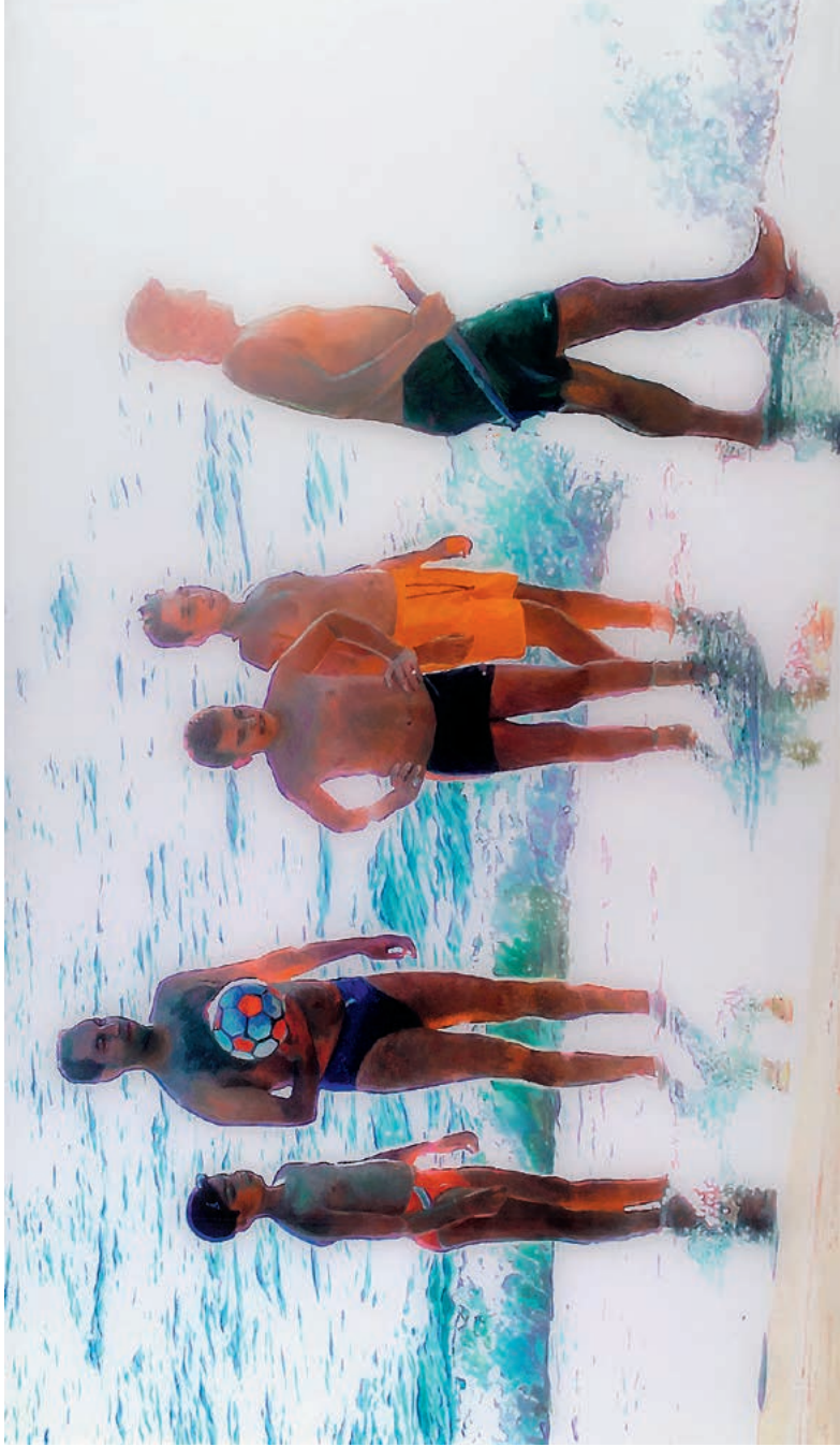
Silvia Gertsch · Sommer, 2008, Hinterglasmalerei, Öl auf Glas, 92 x 160 cm, Courtesy Galerie Monica de Cardens. Foto: Markus Mühlheim