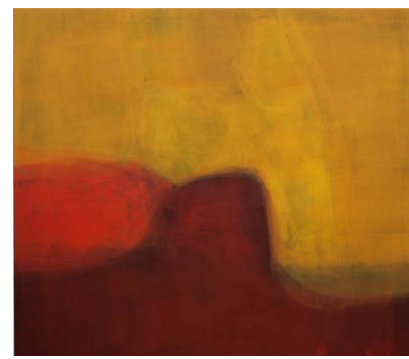
XERXES ACH Due opere «Senza titolo» 2014, cm 140 x 140.

«Entrambi gli artisti espongono da anni in gallerie private (tra le quali Jamileh Weber a Zurigo e Fuchs a Berlino) che in spazi pubblici prestigiosi, e le loro opere si trovano nelle collezioni dei